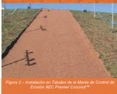
Figura 2.– Instalación en Taludes de la Manta de Control de Erosión AEC Premier Coconut™